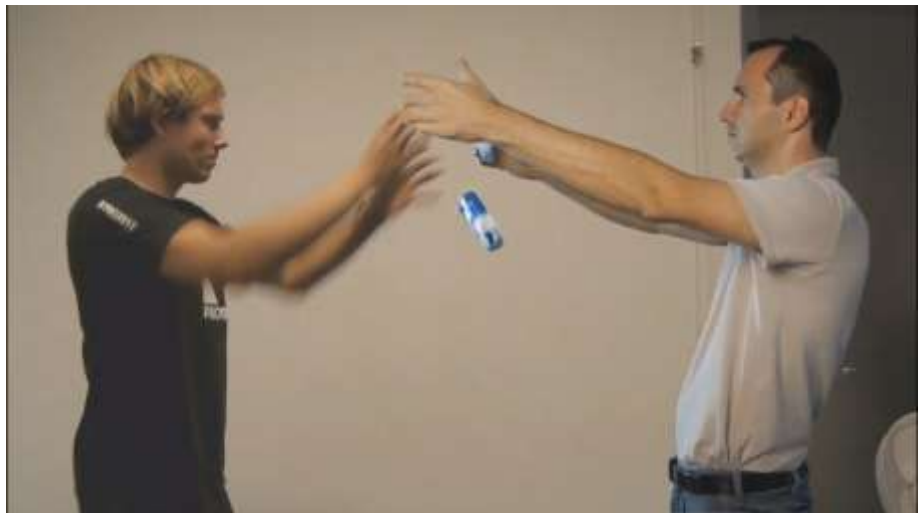
Samengevoegd scene van drop test

STAP 3. Het was ons plan voor omde Twee video's en Beweging gegevens samen te voegen tot één-scène deur de invoering van Verschillende latencies, Maar dat deze methode blijkt niet te analyseren. We hebben alleen samen het zijaanzicht opnames van de stimulus en de onderwerpen om het effect van de latency op de succesvolle uitvoering van de taken (bijvoorbeeld het vangen van een gedaald object) getoond. Deze demonstratie video's zijn nuttig om te laten zien, hoe succesvolle de taak is uitgevoerd afhankelijk van de snelheid van de taak, de aard van de beweging, beeldresolutie en het systeem latency.