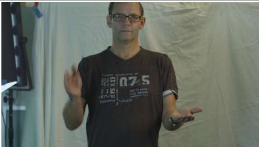
Hand klap spelletje