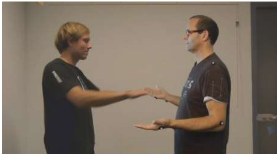
Samengevoegd scene van red hand speel

Van het opgenomen materiaal van hoge snelheid video-en gesynchroniseerd HD-films en motion tracking systeem dat we hebben gewonnen de volgende gegevens handmatig: